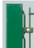
Tvoros tvirtinimo juosta