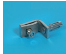
Tvoros tvirtinimo sąvarža