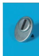
Užrakto apsauga nuo dulkių